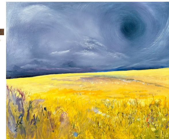
↑ Monique Monod, Indigo , huile sur toile, 30x40 cm