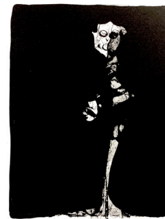
↑ Gilbert Reinhardt, Sans-titre , lithographie, 65x50 cm