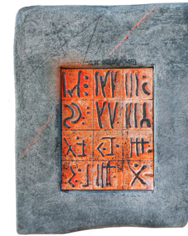
↑ Marie-Claire Meier, Code , pâte de coton et papier, 30x23 cm