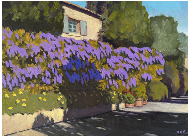
↑ Peter Stalder, Glycine , huile sur toile, 30x40 cm