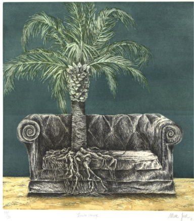
↑ Marc Jurt, Liaison sauvage , eau-forte et aquarelle, 76 x 57 cm