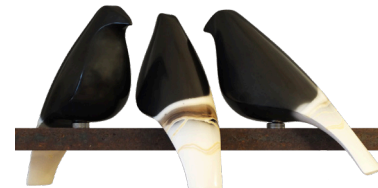
↑ Suzy Balkert, Oiseaux , céramique