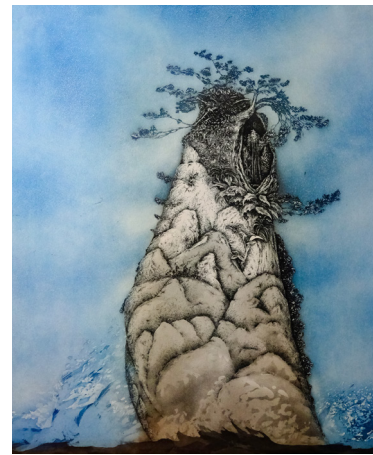
↑ Marc Jurt, Ile tout à fait japonaise , eau-forte et aquarelle, 65x50 cm