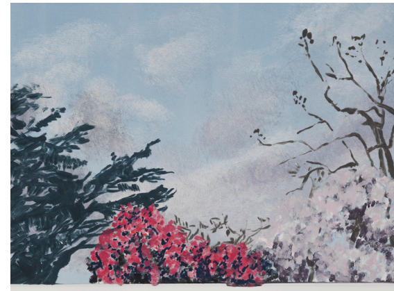
↑ Anne Pantillon, Printemps , monotype sur papier Rives, 31x41 cm