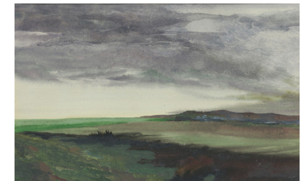
↑ Kurt von Ballmoos, Ciel bas , aquarelle, 20x26 cm