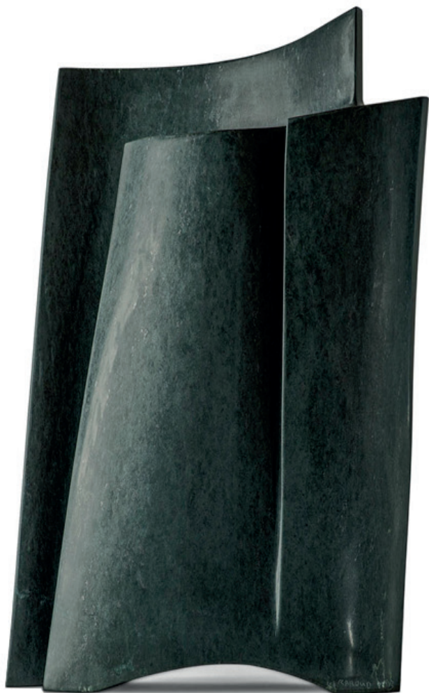
Page marine 3, Serpentine, 70x45x15 cm